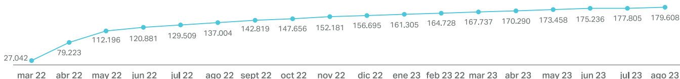
TABLA 4. EVOLUCIÓN CIUDADANOS UCRANIANOS CON PROTECCIÓN TEMPORAL 7